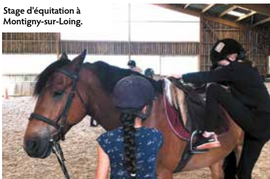
Stage d'équitation à Montigny-sur-Loing.