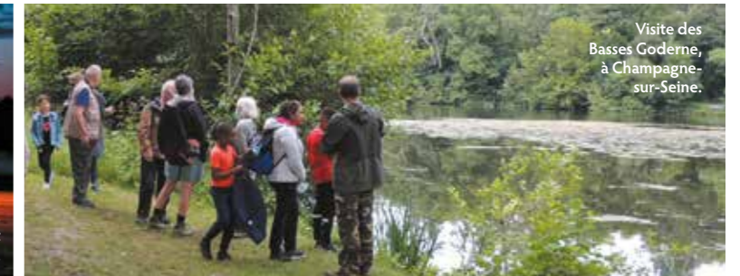
Visite des Basses Goderne, à Champagne-sur-Seine.