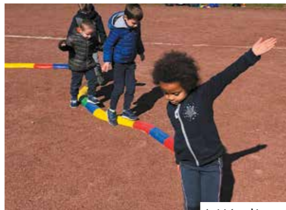
Activités multisports avec les 4-6 ans.

Comme chaque année, MSL a préparé un programme d'activités éclectique, tour à tour sportif, créatif, ludique, numérique, aquatique, musical et même théâtral... Plus d'une centaine d'activités différentes pour tous : les 4-17 ans, les 11-18 ans, les adultes et les familles.