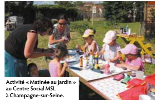
Activité « Matinée au jardin » au Centre Social MSL à Champagne-sur-Seine.