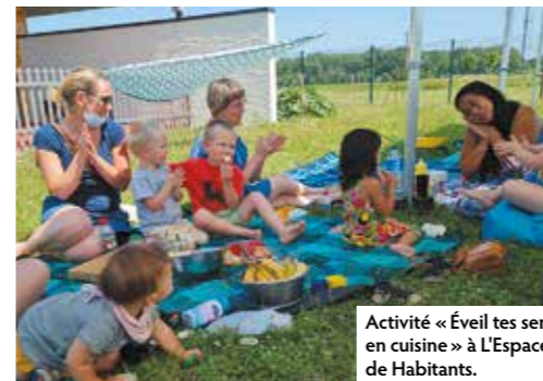
Activité « Éveil tes sens en cuisine » à L'Espace de Habitants.