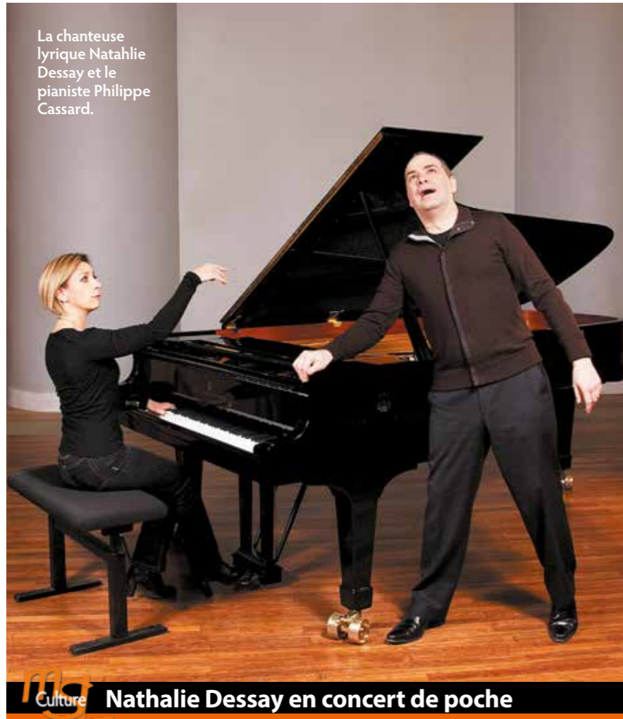
La chanteuse lyrique Nathalie Dessay et le pianiste Philippe Cassard.