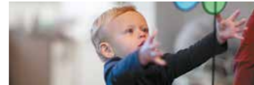
LES ACTUS L'actualité en Seine & Loing p.8