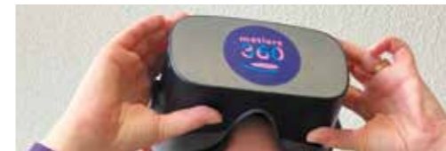
LA 1ÈRE JOURNÉE DE L'EMPLOI MSL Reportage p.20