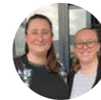
MSL & VOUS p.30