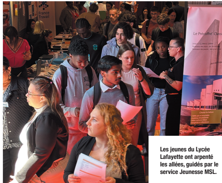
Les jeunes du Lycée Lafayette ont arpenté les allées, guidés par le service Jeunesse MSL.

580 visiteurs, 50 exposants – dont de nombreuses entreprises locales – et 300 offres à pourvoir: la Journée de l'emploi a permis de créer des liens directs entre candidats et recruteurs, pour des postes en CDI, CDD, des stages ou des emplois saisonniers. Une occasion unique de convaincre en face à face et, peut-être, de décrocher son futur emploi à deux pas de chez soi !