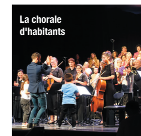
La chorale d'habitants