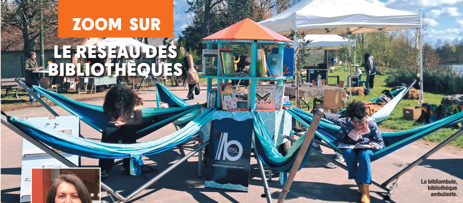
La bibliambule, bibliothèque ambulante.