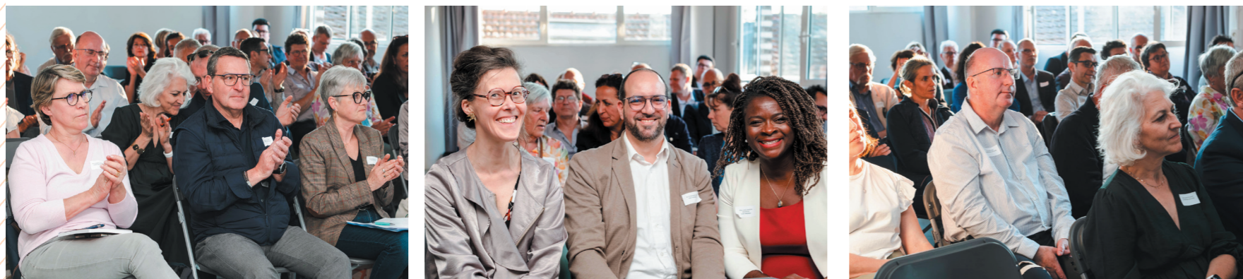
Première réunion du conseil communautaire, mercredi 8 avril.