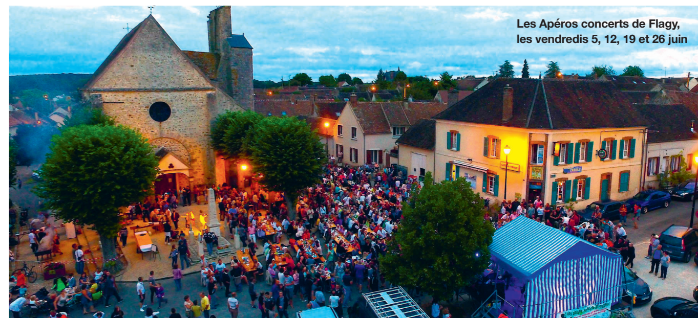
Les Apéros concerts de Flagy, les vendredis 5, 12, 19 et 26 juin