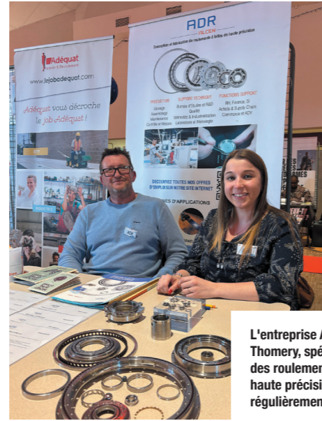
L'entreprise ADR de Thomery, spécialiste des roulements à billes haute précision recrute régulièrement.