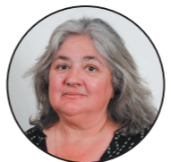
CAROLE LOVERGNE Conseillère communautaire Maire de Remauville