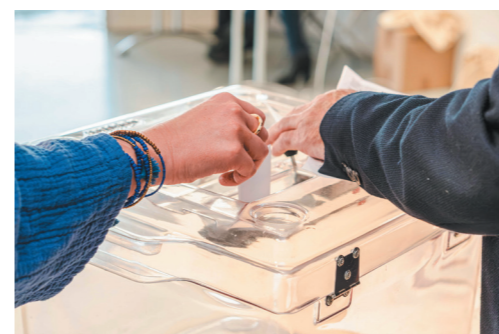
EN COUVERTURE Découvrez vos nouveaux élus MSL p.16