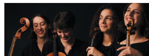
LES ACTUS L'actualité de Moret Seine & Loing p.8