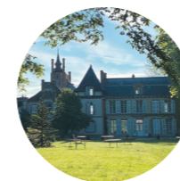
AGENDA DES SORTIES p.26