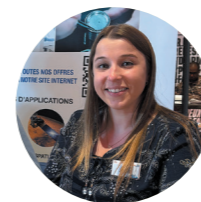
L'ACTU EN IMAGES p.6