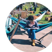
MSL & VOUS p.30