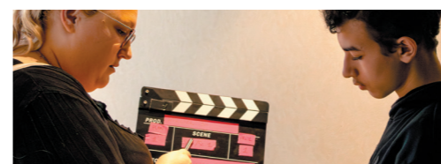
FESTIVAL #JEUNESSE Les jeunes s'engagent contre le cyberharcèlement p.14