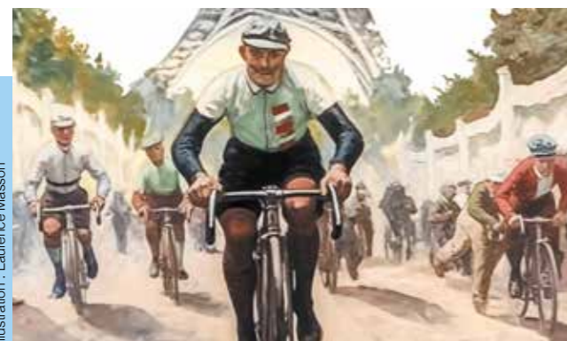
Illustration : Laurence Masson