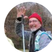
L'ACTU EN IMAGES p.6