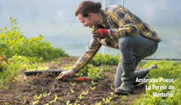
Ambroise Prieur, La Ferme de Madame.