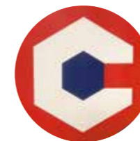
MSL & VOUS p.30