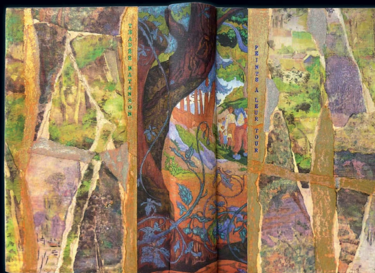
Reliure d'art sur « Peints à leur tour », de Thadée Natanson