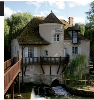
Le Moulin Provencher

Un lieu bucolique et prestigieux, une nouvelle muséographie, une histoire pleine de rebondissements et de gourmandise, tout participe au succès de ce nouveau Musée qui abrite le plus vieux bonbon de France.