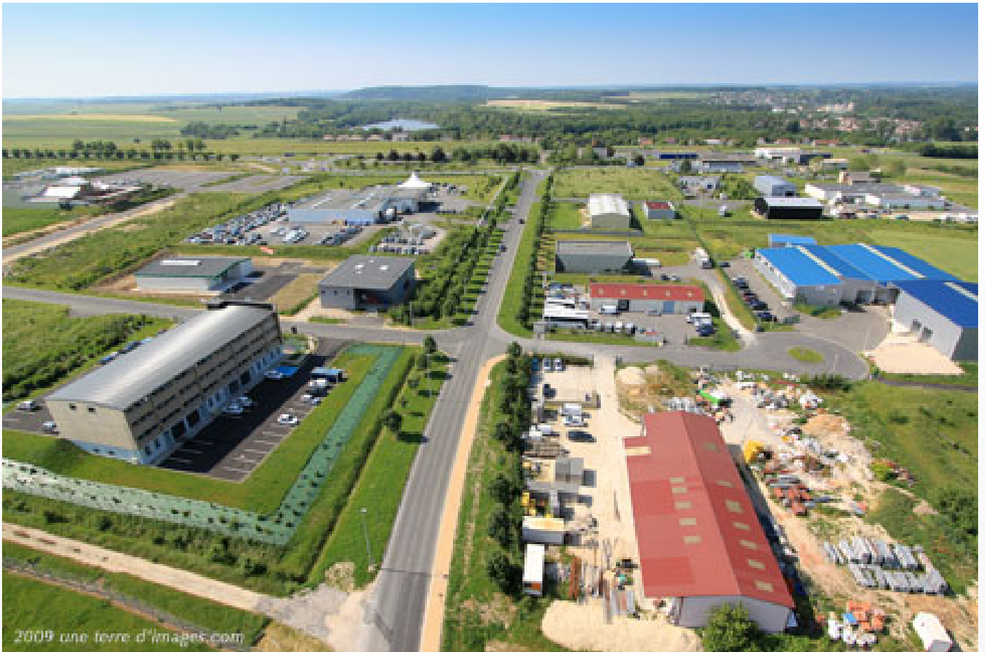
Le Pôle Économique des Renardières